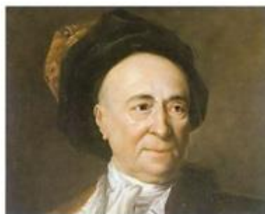
Fontenelle par Nicolas de Largillière

L'écrivain Bernard Le Bouyer de Fontenelle , né le 11 février 1657 est mort le 9 janvier 1757. Ce matin-là, à presque 100 ans, il répondit à son médecin qui lui demandait quel mal il ressentait :